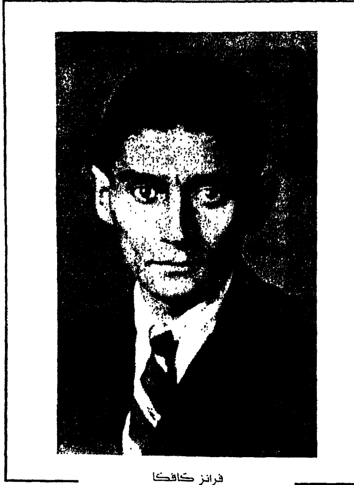
فرانز كافكا آخر صورة (برلين، عام ١٩٢٤)